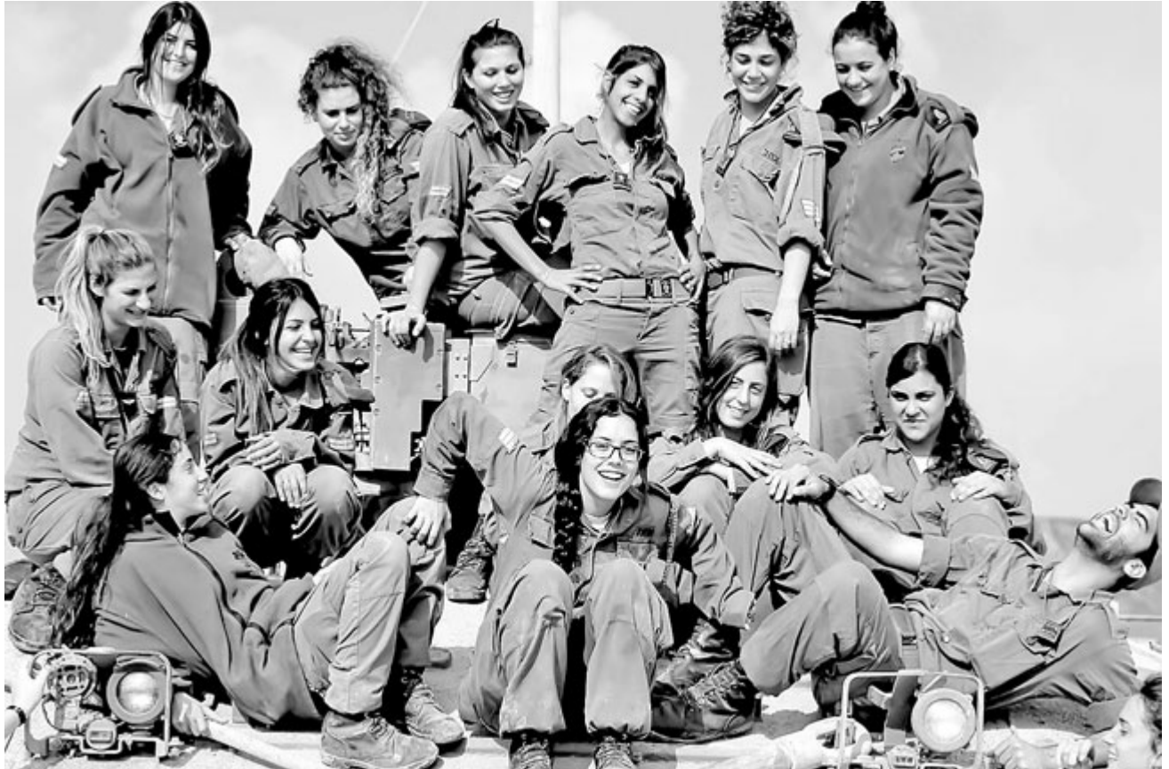
Tenkovske instruktorke u Izraelu

Autor: Zorica Mrševićsreda, 04.01.2017. u 08:15